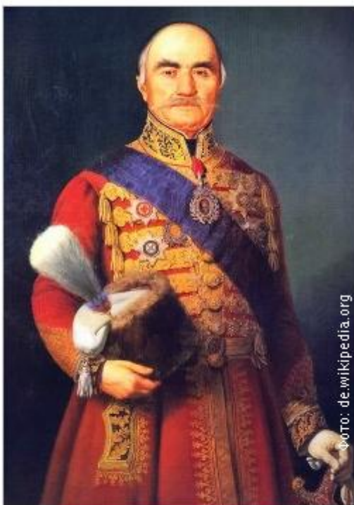
Knez Miloš Obrenović

Domaći kustosi su ovaj sat videli samo na fotografijama. Zbog grba koji je bio karakterističan za epohu Mihajla Obrenovića nisu sigurni da je u pitanju baš Milošev sat. Ako jeste, kažu, mesto mu je mesto u postojbini. Šta ih sprečava da ga vrate?