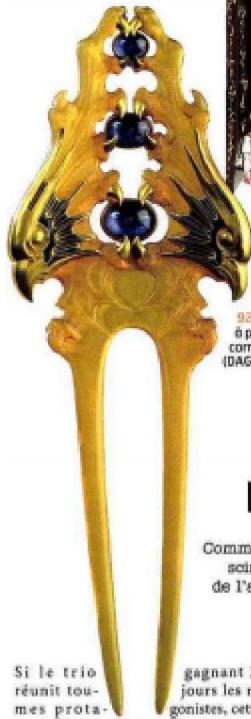
92 500 € René Lalique, peigne à profils de rapaces, v. 1900, corne, émail, or, H. 16,5 cm (DAGUERRE, Paris, 14 juin).