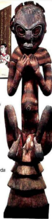
2,5 M€ Figure de toilette cérémonielle Bivot, Papouasie Nouvelle-Guinée, xvi e -xvii e siècle, H. 105 cm (CHRISTIE'S, Paris, 19 juin).