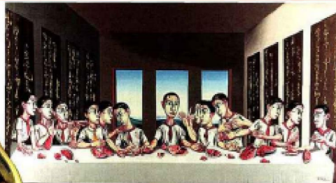
HK$ 190 MILLIONS (17 M€) Zeng Fanzhi, The Last Supper, 2001, huile sur toile, 220 x 395 cm (SOTHEBY'S, Hong-Kong, 5 octobre).