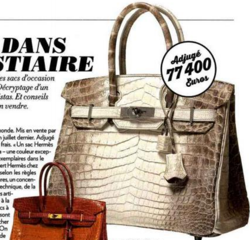
La cote du Birkin d'Hermès ne cesse de grimper : adjugé 63 000 euros en mai dernier, il a atteint 77 400 euros en juillet.

C'est le recordbag du monde. Mis en vente par Artcurial à Monaco en juillet dernier. Adjugé 77 400 euros. Sans les frais. « Un sac Hermès modèle Birkin, en croco Himalaya – une couleur exceptionnelle – dont il existe 5 à 10 exemplaires dans le monde », estime Cyril Pigot, l'expert Hermès chez Artcurial. Une « pièce unique », selon les règles du marché de l'art pour les sculptures, un concentré de virtuosité et de prouesse technique, de la recherche de la peau au travail des artisans qui l'ont entièrement réalisé à la main. Introuvable, la Rolls des sacs à main, si désirable que certaines sont prêtes à tout. Jusqu'à payer plus cher l'occasion que le neuf. Dingue. « On vit dans la frénésie du "tout, tout de suite", l'identification aux égéries, qui dopent le marché de l'occasion pour les accessoires de mode, les montres, la joaillerie », souligne Yann Le Floch, fondateur du site français Instantluxe.com. Et il y a pénurie de Birkin. Trop de clientes, surtout dans les pays émergents, pas assez d'exemplaires produits. Ce qui en fait le sac le plus convoité au monde. « Même à 6 500 euros en moyenne en boutique, c'est un vrai "placement pierre" qui, en très bon état, pourra être revendu de 8 500 à 12 000 euros », analyse Yann Le Floch. Certaines femmes craquent. Elles en ont les