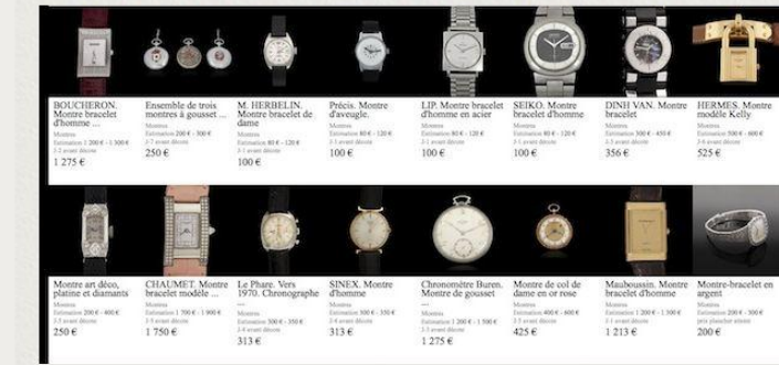
Les montres @ Capture d'écran

Pour toute commande validée entre 10h et 15h et sur demande par téléphone auprès d' Expertissim , les pères Noël d'un jour sont assurés de recevoir leurs cadeaux de moins d'1m30 à leur domicile, leur bureau ou l'adresse de leur choix, dans les plus brefs délais et même le 24 décembre ! Tout au long de l'année, Expertissim met tout en œuvre pour livrer ses objets d'art dans les meilleures conditions et délais possibles : en 48 heures pour toute la France, par UPS , coursier, transporteur ou encore retrait dans ses locaux.