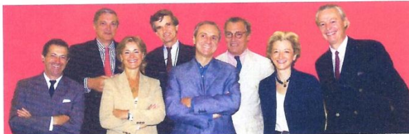
Des experts souriants pour le lancement d'Expertissim.com ! Ce nouveau site internet de vente d'objets d'art expertisés regroupe 27 professionnels représentant l'ensemble des spécialités du marché.