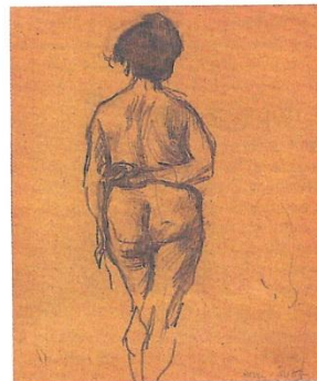
Dessin de Matisse (petite tache d'humidité, papier isolé, de 20 000 à 25 000 €) vendu avec certificat sur Expertissim.com.