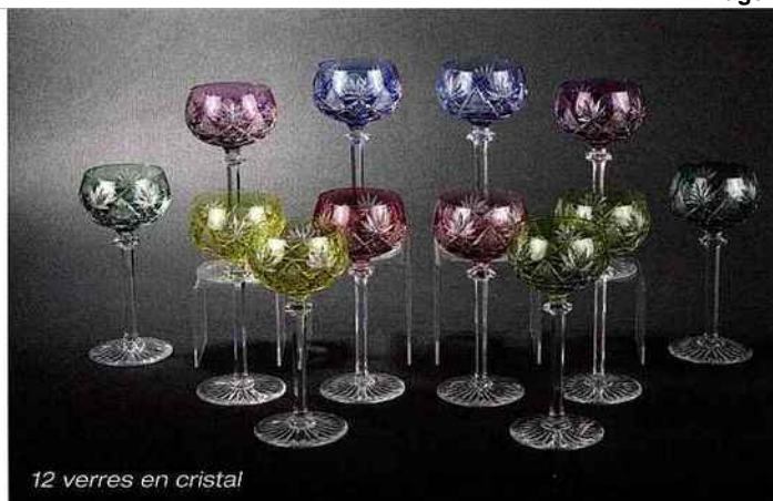
12 verres en cristal

Certains se tournent vers les plateformes d'enchères sur Internet. Mais celles-ci n'apportent pas de garantie ni d'expertise. De plus, vendeurs et acheteurs sont en contact direct, ce qui pose des problèmes de confidentialité, de sécurité et de paiement.