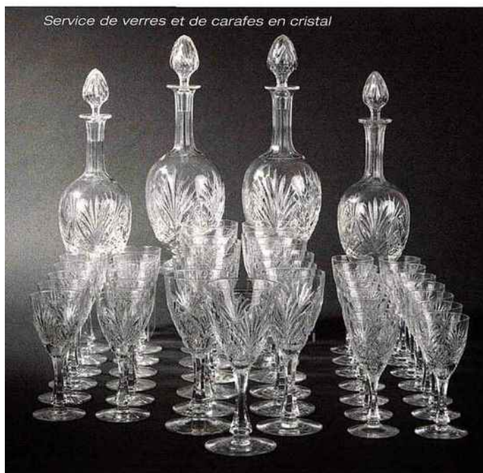
Service de verres et de carafes en cristal