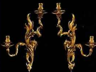
Appliques Louis XV