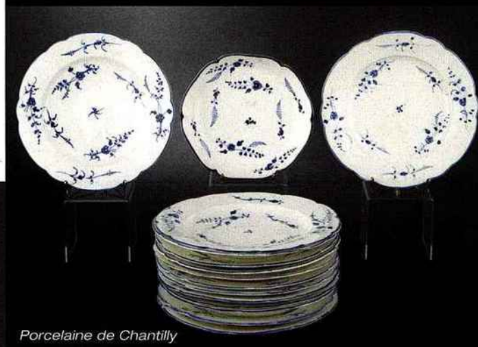
Porcelaine de Chantilly