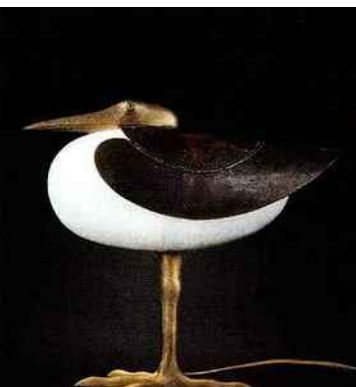
Lampe échassier Lalanne