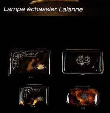
Quatre boîtes en écaille