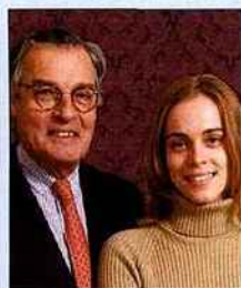
■ Cabinet Portier – Th. Portier & A. Bulmann. Experts en Arts asiatiques.